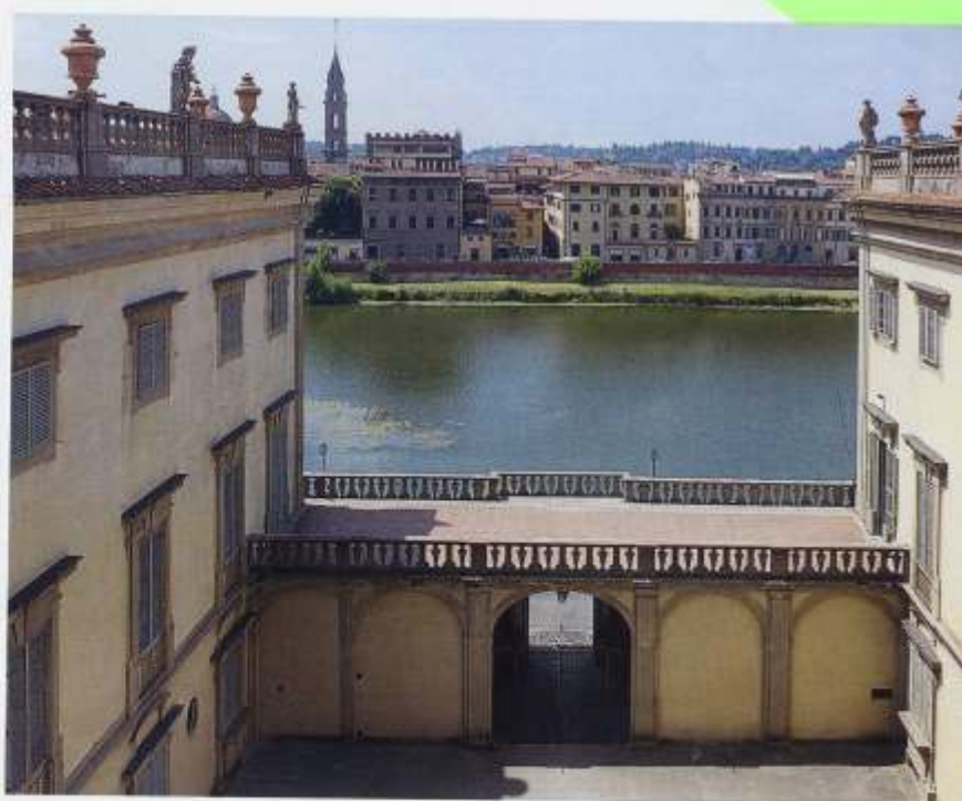
Центральная терраса дворца

Дворец Корсини для меня — не просто здание, а настоящая страсть. Я продолжаю дело по модернизации