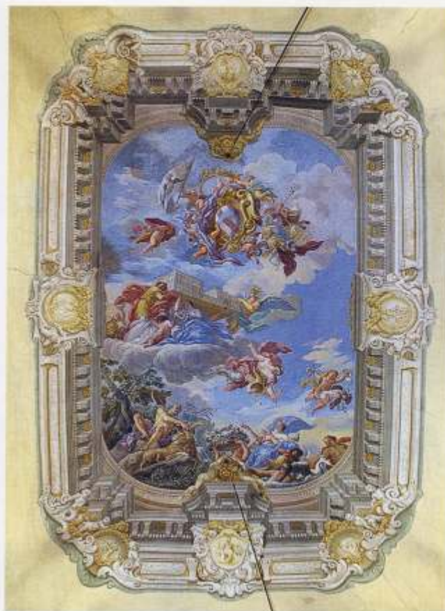
Фреска Антона Доменико Габбьяни (Anton Domenico Gabbiani) «Прославление семьи Корсини», украшающая потолок Тронного зала

эсклюзивных праздников, которые способствуют финансированию реставрационных работ.